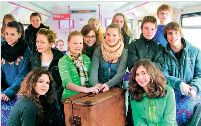
Abb. 4: So macht Schule Spaß: Schüler/innen der 8d des Kaltenkirchener Gymnasiums proben in einem AKN-Triebwagen für ihren großen Auftritt.