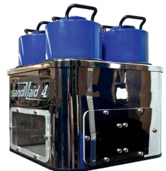
Abb. 1: Die Sand Maid.

an der Außenseite aus. Dies bedeutet eine erhebliche Vereinfachung für den Fahrzeughersteller. Das System wird dadurch spürbar günstiger. Für das Verkehrsunternehmen ergibt sich der Vorteil, dass die Fahrzeuge